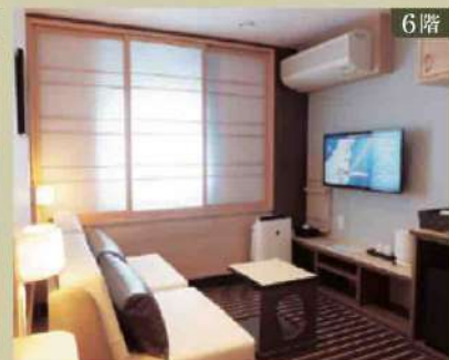
6階 【ウイズペット オーシャンビュー】定員2名×2室 ベッドタイプ/チェアベッド2台 ※窓開閉不可