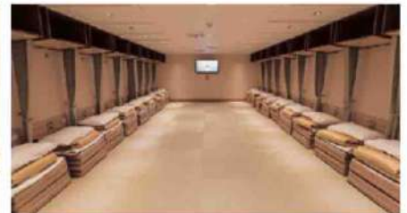
最大定員25名×1室、最大定員11名×2室