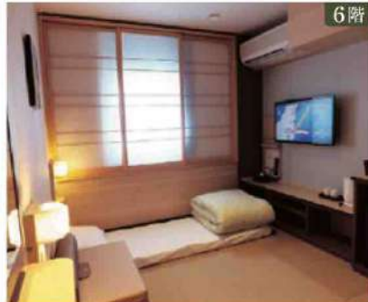
6階 【オーシャンビュー和室】定員2名(最大3名)×13室 ベッドタイプ/折畳マットレス3台 ※窓開閉不可