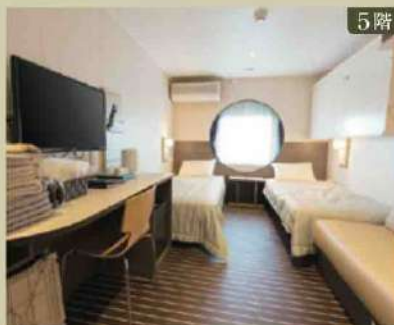
5階 【ウイズペット オーシャンビュー】定員4名×2室 ベッドタイプ/ベッド2台、ソファベッド1台、ブルマンベッド1台 ※3人目はソファベッド、4人目はブルマンベッドのご利用となります。 ※窓開閉不可