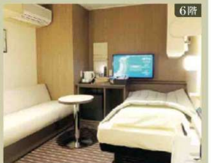
6階 【ウイズペット インサイド】定員2名(最大3名)×1室 ベッドタイプ/ベッド1台、ソファベッド1台、ブルマンベッド1台 ※2人目はソファベッド、3人目はブルマンベッドのご利用となります。