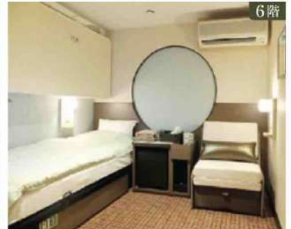
6階 【インサイド洋室】定員2名(最大3名)×34室 ベッドタイプ/ベッド1台、チェアベッド1台、ブルマンベッド1台 ※2人目はチェアベッド、3人目はブルマンベッドのご利用となります。