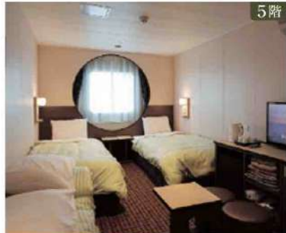
5階 【オーシャンビュー和洋室】定員4名×18室 ベッドタイプ/ベッド2台、折畳マットレス2台 ※窓開閉不可

設備/シャワー&トイレユニット、テレビ、冷蔵庫 他 備品/バジャマ、バスタオル、フェイスタオル、バスマット、スリッパ、電気ケトル、ドライヤー、アメニティ(ボディータオル・シャンプー・コンディショナー・ボディーソープ・歯ブラシセット・綿棒・お茶(梅こぶ茶・煎茶スティック))