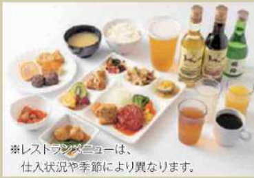
※レストランメニューは、仕入状況や季節により異なります。